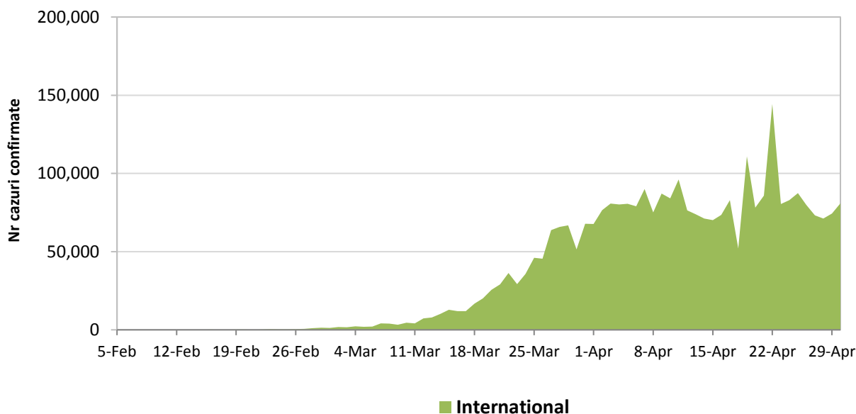
Evolutia zilnica a numarului de cazuri confirmate de infectii cu coronavirus (COVID19) - in afara Chinei Continentale