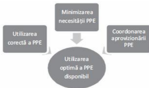
Fig. 1. Strategii de optimizare a disponibilității echipamentului individual de protecție (PPE)

Având în vedere deficitul global de echipament individual de protecție, următoarele strategii pot facilita utilizarea optimă a PPE (fig. 1).